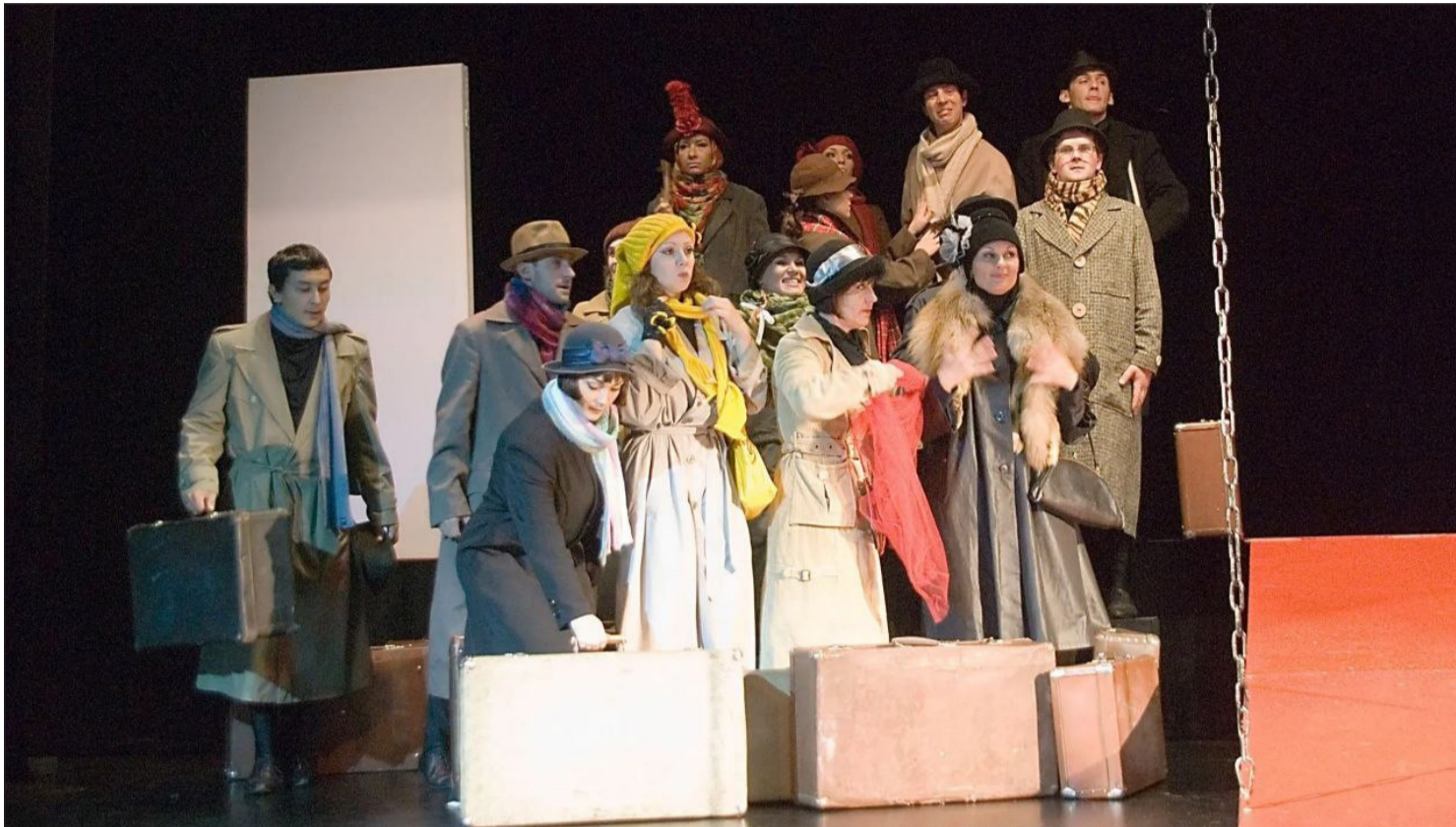
▲ 3월 27일은 세계 연극의 날이다. 이날 사할린 체호브센터와 사할린인형극장에서 이와 관련 행사가 펼쳐진다.