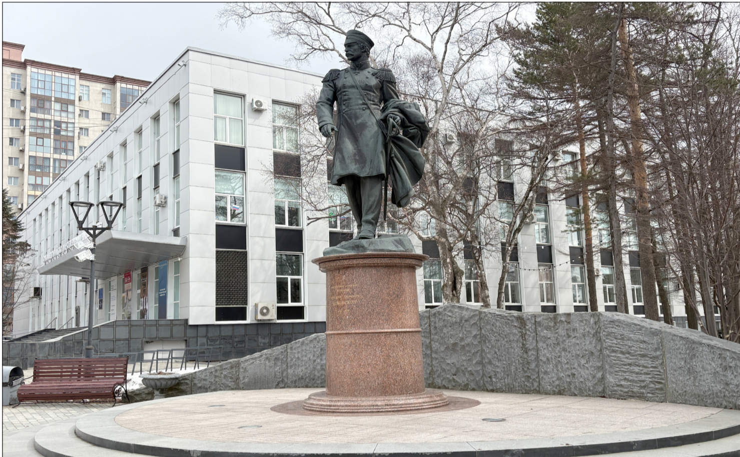
▲ 4월 18일은 세계 유산의 날(세계 기념물과 유적지의 날)이다. 유즈노사할린스크시, 사할린이 섬이라는 것을 밝혀낸 겐나지 네벨스코이 제독의 동상.