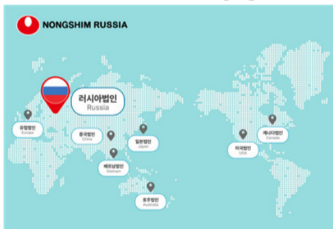
농심 해외법인 세계지도 그래픽 이미지[농심]

는다. 농심은 신라면, 너구리, 김치라면 등 기존 인기 제품과 함께 '신라면 톰바', '김치볶음면' 등 신제품을 빠르게 투입해 시장 대응력을 높일 방침이다.