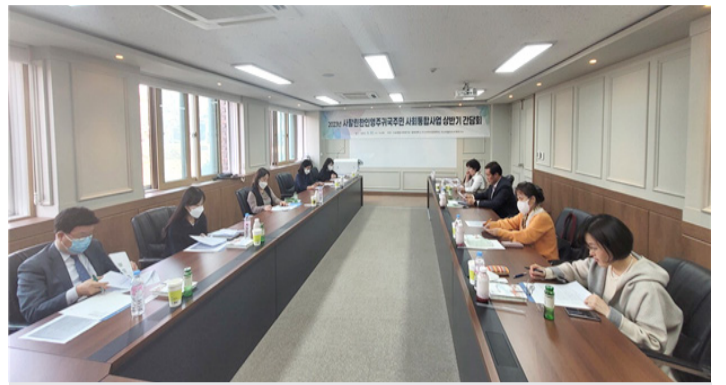
간담회 모습

충북대 러시아어문화학과는 지난달 17일 오송종합사회복지관과 업무협약을 체결한 데 이어 이번 간담회를 학내에서 개최하면서 민간학이 주도하는 해당 사업의 주도적인 역할을 담당하고 있다.