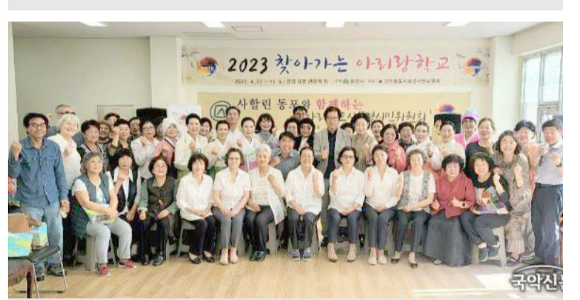
(사진) 행사를 마치고 사할린아리랑보존회와 아도위의 기념촬영. 사진은 첫째줄이 사할린아리랑보존회, 뒤줄이 아도위 회원들과 내빈들. 2023.06.11.