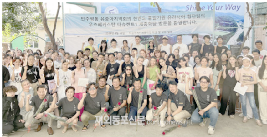
우즈베키스탄 타슈켄트 세종학당 학생들과 시상식 후

심이라고 했습니다. 그래서 심었습니다. 세계에 그런 옥수수가 없었습니다. 옥수수를 얼마나 열심히 심었는지, 6미터에 달했습니다. 옥수수 하나가 43센티미터였습니다. 그래서 대통령한테도 그 옥수수를 보내줬습니다. 오직 고려 사람만 그렇게 할 수 있었습니다. 우리 고려인들은 '죽도록, 죽어도 한다. 된다'고 말합니다. '못한다, 힘없다'라는 말은 없습니다. 그래서 우리 아이들도 그렇게 가르칩니다. 고려인은 눈치도 빠르고 기다리지 않습니다. 그리고 우즈벡 사람들은 착하고 친절합니다. 음식 없어도 들어와라 들어와라 하며 나눠먹자고 합니다."라며 일화를 통해 고려인의 근면성실함과 강인함을 소개해주었다.