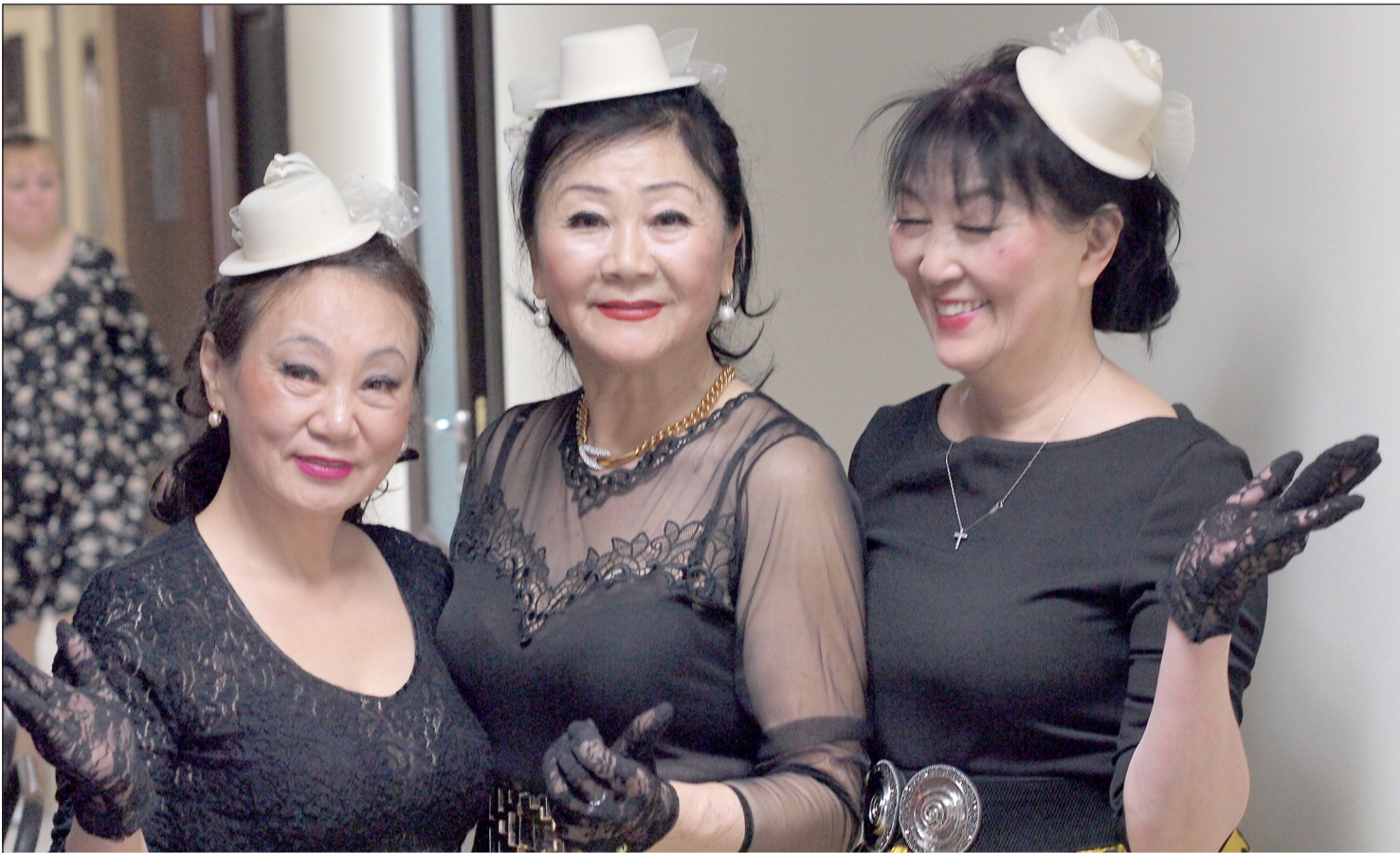
▲ 10월 1일은 러시아에서 노인의 날을 기념한다. 춤을 통해 제2 젊음을 되찾고 있는 '희망'무용단의 멤버들.

2023년 9월 29일(금) --(음력 8월 15일)-- Пятница 29 сентября 2023 г. № 38 (12055) 1949년 6월 1일 창간 ----- Цена свободная