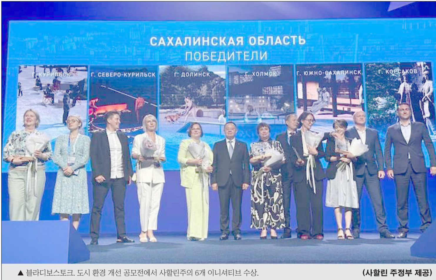
▲ 블라디보스토크. 도시 환경 개선 공모전에서 сахалин주의 6개 이니셔티브 수상.