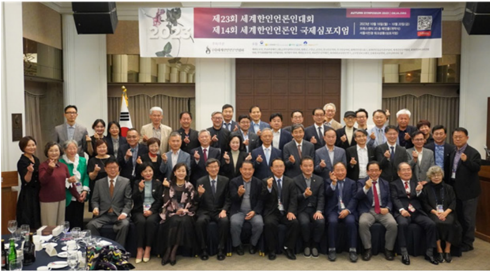
▲ (사진) (사)세계한인언론인협회 주최 '2023 세계한인언론인 국제심포지엄'이 10월 16일, 서울 프레스센터에서 개막했다.