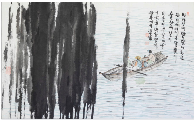
Пак Хен Бо (1935 г.р.) «... мы плывём по реке». 2016 г. Бумага, тушь, водяные краски. 58,5x95,5; 65,5x108 Поступление: дар автора, 2016 г. КП-10232 Ж/в-1436

Пак Хен Бо - один из старейших мастеров в современном искусстве Республики Корея, приверженец направления мунинхва, принадлежит поколению, чье творческое становление выпало на десятилетие 1960-70-х. Безусловно, это был период актуализации поисков индивидуального творческого почерка и осознания своей роли в искусстве. Гармоническое слияние рационального (интеллектуального) и поэтического начал отличает летний пейзаж «...мы плывём по реке».