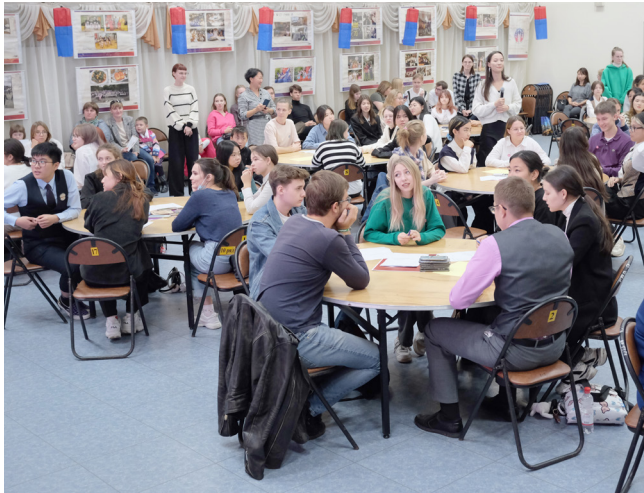
고르스크 같은 경우 사할린주한인협회가 운영하는 한국어반이 있다. 그리고 사할린한국교육원에서 한국어 학습을 위한 무료 강좌를 진행한다.

흥미롭게도 한국어를 배우고 싶어하는 사람들이 늘어나고 있다. 현대 상황에서 두 가지 외국어에 대한 지식과 이러한 언