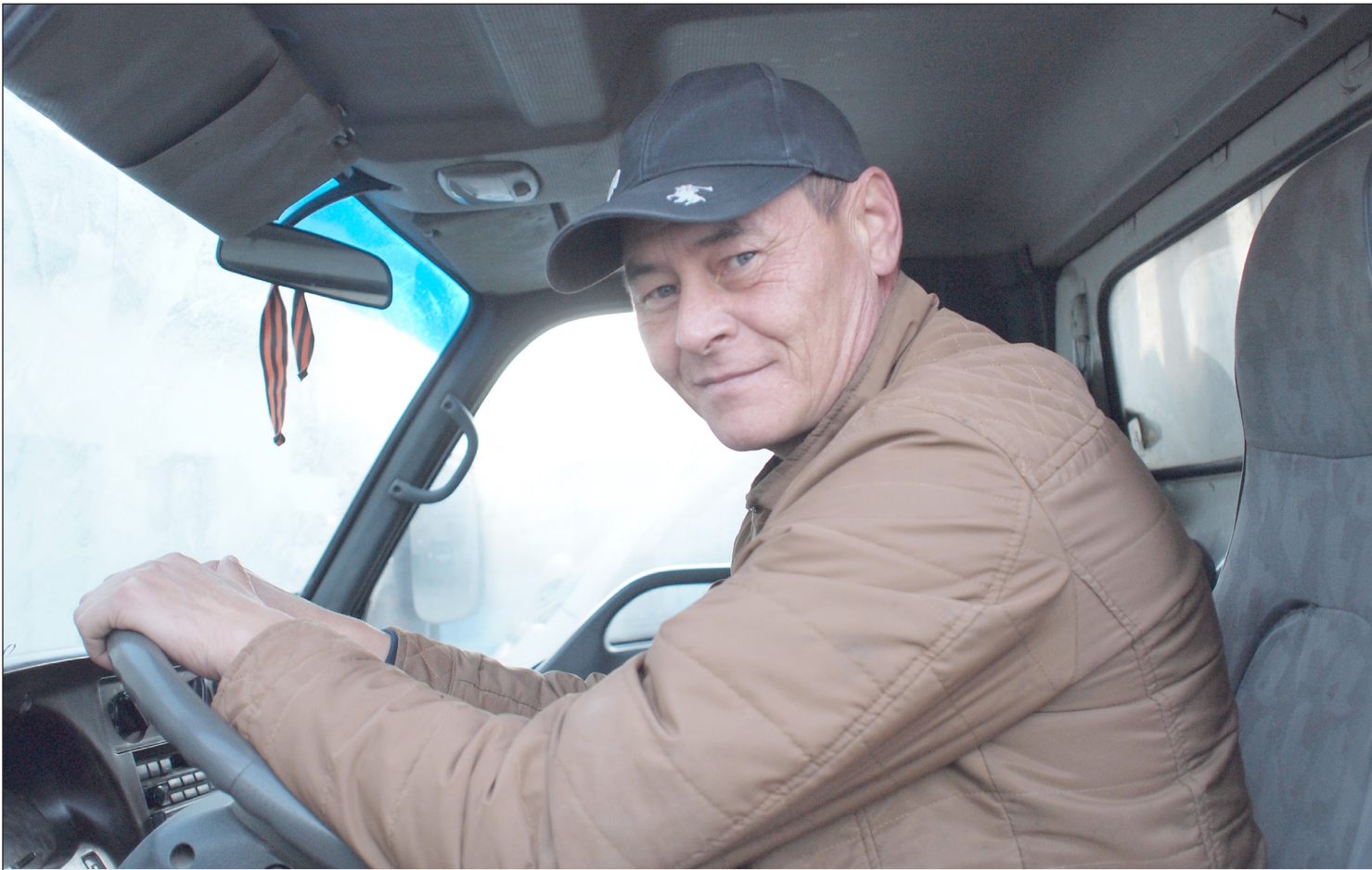
10월 29일에 러시아에서 도로 운송 근로자들의 날을 기념한다.

2023년 10월 27일(금) ...(음력 9월 13일)... Пятница 27 октября 2023 г. № 41 (12058) 1949년 6월 1일 창간 ..... Цена свободная