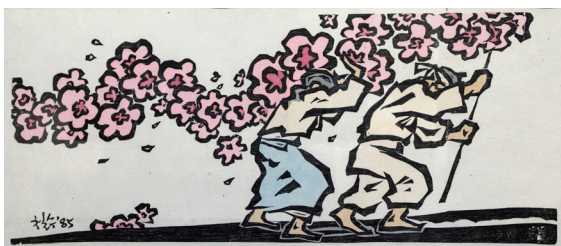
И Чоль Су (1954 г.р.). Провинция Чхунчхон-до О, цветы в холодный день! 1985 Бумага ханчжи, цветная ксилография. 36x92 Поступление: с персональной выставки «В поисках гармонии» (СОХМ), 2017 КП- 10283 Г/в- 4252

Я р к и м представителем искусства современной корейской гравюры является известный мастер И Чоль Су. После первой персональной выставки, состоявшейся в Сеульской галерее Кванхун в 1981 году, его имя стало знаковым,