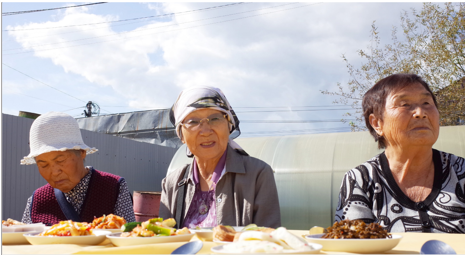
▲ 11월의 마지막 일요일 러시아에서 어머니의 날을 기념한다. 올해는 이 명절은 11월 26일에 쉰다. 유즈노사할린스크시한인회의 노인정 모임을 찾아온 할머니들.

2023년 11월 24일(금) (윤력 10월 12일) Пятница 24 ноября 2023 г. № 45 (12062) 1949년 6월 1일 창간 Цена свободная