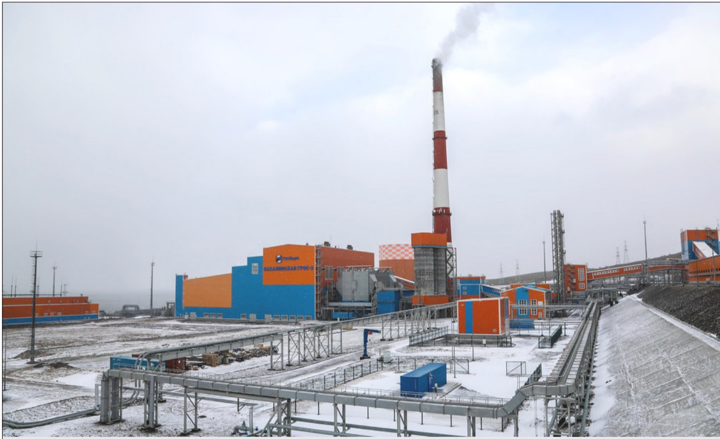
▲ 12월 22일 러시아에서 에너지 분야 근로자의 날을 기념한다. 사할린 전기발전소 (일리인스코예마을).

2023년 12월 22일 (금) (윤력 11월 10일) Пятница 22 декабря 2023 г. № 49 (12066) 1949년 6월 1일 창간 Цена свободная