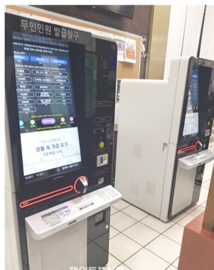
주로스앤젤레스총영사관에 설치된 재외공관 무인민원증명발급기

재외동포청은 "이번 시범운영을 통해 개선사항을 발굴하고, 향후에도 재외동포 맞춤형 서비스를 지속적으로 제공할 예정"이라고 말했다.