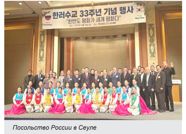
Посольство России в Сеуле

Он также напомнил недавнее высказывание президента РФ Владимира Путина, обращенное к южнокорейскому правительству: "Москва готова к тому, чтобы