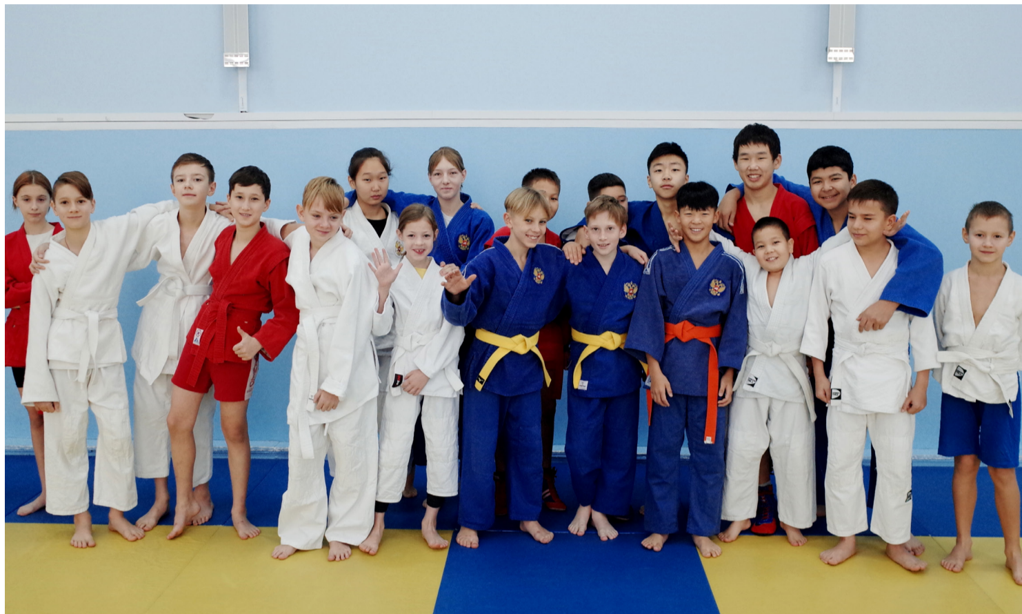
▲ 11월 16일은 전 러시아 삼보의 날이다. 국가예산기관인 «삼보 및 유도 스포츠 학교»학교에는 305명의 학생이 다니고 있다.