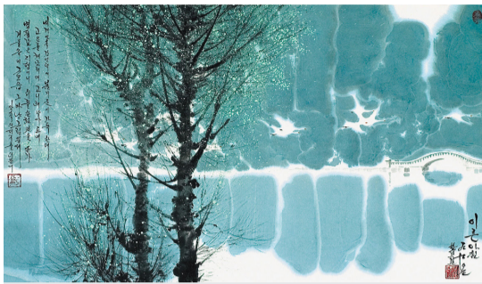
Хон Сон Чоль (1958 г.р.). КНДР Раннее утро. 1989 Бумага, водяные краски. 87x51,5; 100,5x60 Поступление: из творческого объединения «Мансудэ», 1990 КП-2809 Г/в-655