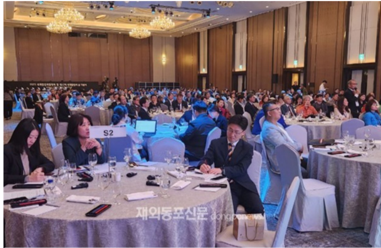
'2023 세계한인회장대회' 셋째 날 오후 프로그램으로 '정부와의 대화'가 진행됐다.

그러면서 장 과장은 "국적회복을 원하는 재외동포는 주소지 관할 출입국외국인청(사무소)나 재외공관