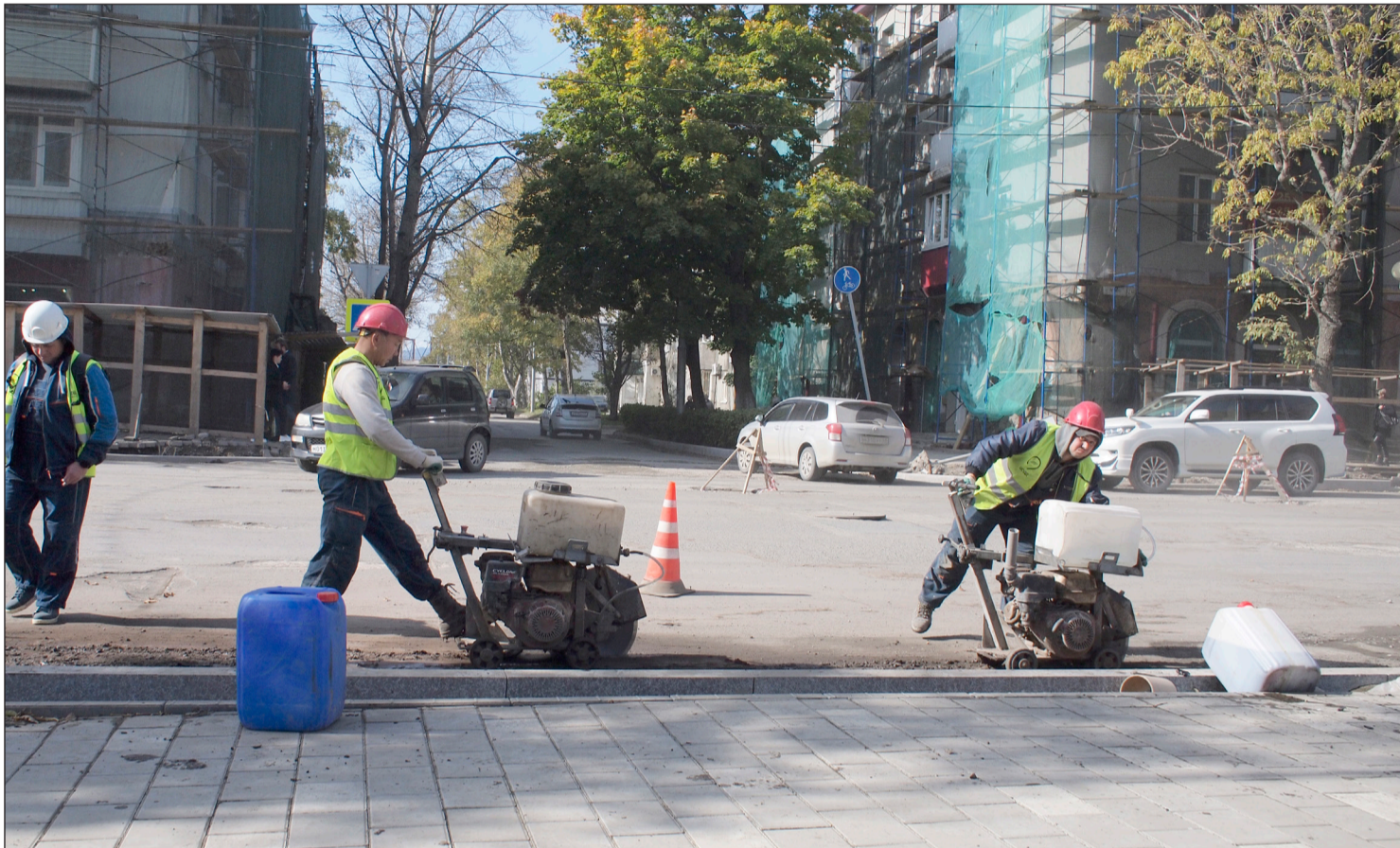
▲ 10월 15일 러시아에서 직업적 명절인 도로사업 분야 근로자들의 날을 기념한다.

2023년 10월 13일(금) --(음력 8월 29일)-- Пятница 13 октября 2023 г. № 40 (12057) 1949년 6월 1일 창간 ----- Цена свободная