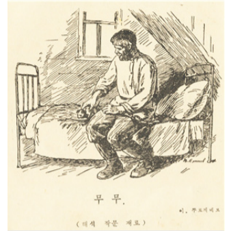
Фрагмент из советского учебника на корейском языке с повестью И. Тургенева «Муму»

Данные учебники стали библиографической редкостью и сейчас хранятся в редакции газеты «Сэ корё синмун».