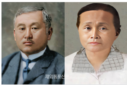
최재형 선생-최 엘레나 여사의 옛 사진을 AI로 복원한 이미지

국가보훈부(장관 박민식)는 8월 1일 독립운동가 최재형 선생 순국 장소로 추정되는 러시아 우수리스크의 흉과 70여 년간 키르기스스탄 공동묘지에 묻혀 있던 부인 최 엘레나 여사의 유해를 모셔 와, 원래 최재형 선생의 묘가 있던 국립서울현충원 애국지사 묘역 108번 자리에 합장한다고 밝혔다.