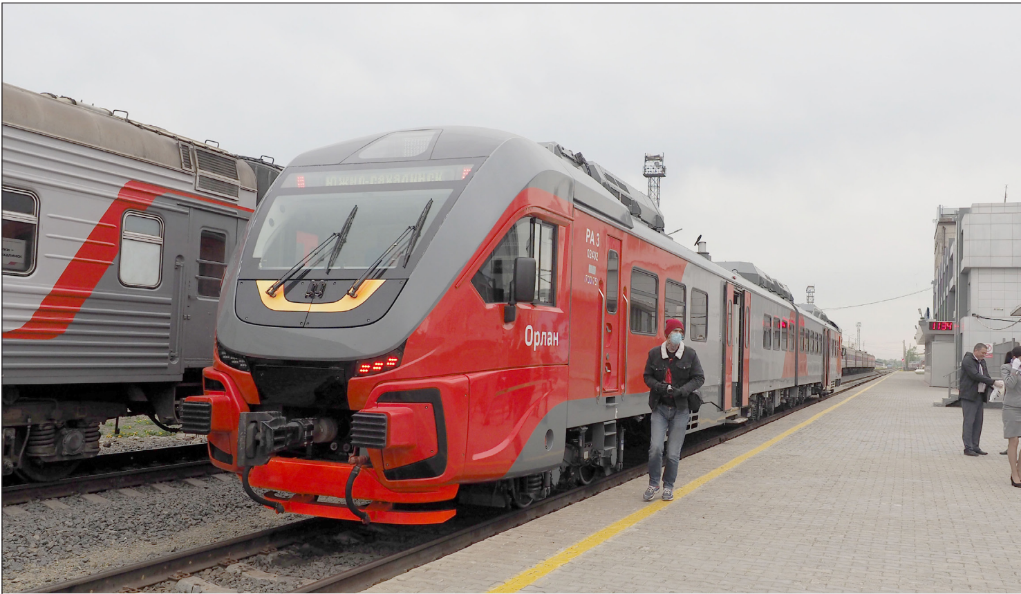
▲ 8월의 첫 일요일에 러시아에서 철도 근로자의 날을 기념한다. 올해 이 직업적 명절은 8월 6일이다. 유즈노사할린스크 시 철도역.

2023년 8월 4일(금) --(음력 6월 18일)-- Пятница 4 августа 2023 г. № 30 (12047) 1949년 6월 1일 창간 ----- Цена свободная