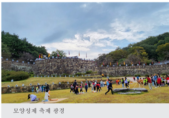
모양성제 축제 풍경

는 '고창 웰파크시티'가 있다. 방장산에서는 패러글라이딩을 할 수 있고, 상하농원에서는 농사를 체험하고 이곳에서 생산된 식재료로 음식을 만드는 체험을 할 수 있다. 람사르갯벌센터에는 놀이시설, 체육시설, 산책길, 자전거 도로 등 레저 시설과 함께 조개잡이 체험 프로그램도 있다.