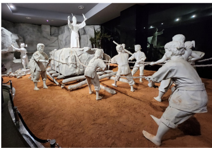
고인돌 운반 광경을 그린 조형물