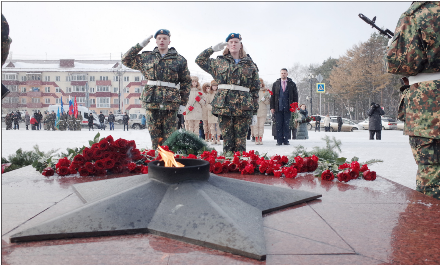
▲ 12월 3일 러시아에서 무명용사의 날을 기념한다.