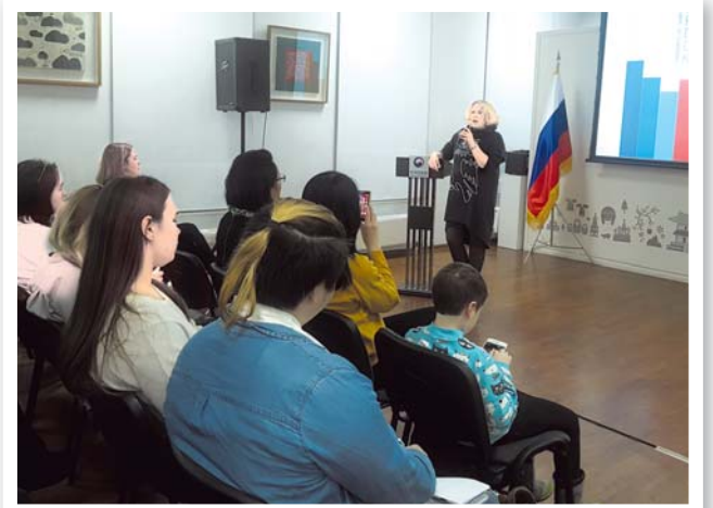
На лекции было приведено множество примеров социальной рекламы в Корее, как на телевидении, так и размещённой в городской среде

В рамках лекции были представлены результаты исследования вопросов развития социальной рекламы в Корее, примеры рекламных плакатов и роликов. Также были рассмотрены вопросы участия некоммерческих организаций, государственных органов, СМИ и бизнеса в создании и размещении социальной ре-