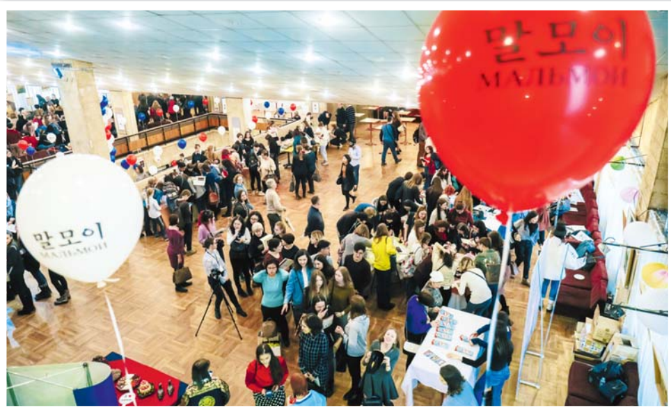
Фойе большого зала Дома кино украшено к фестивалю

Мероприятия, организованные Культурным центром Посольства Республики Корея