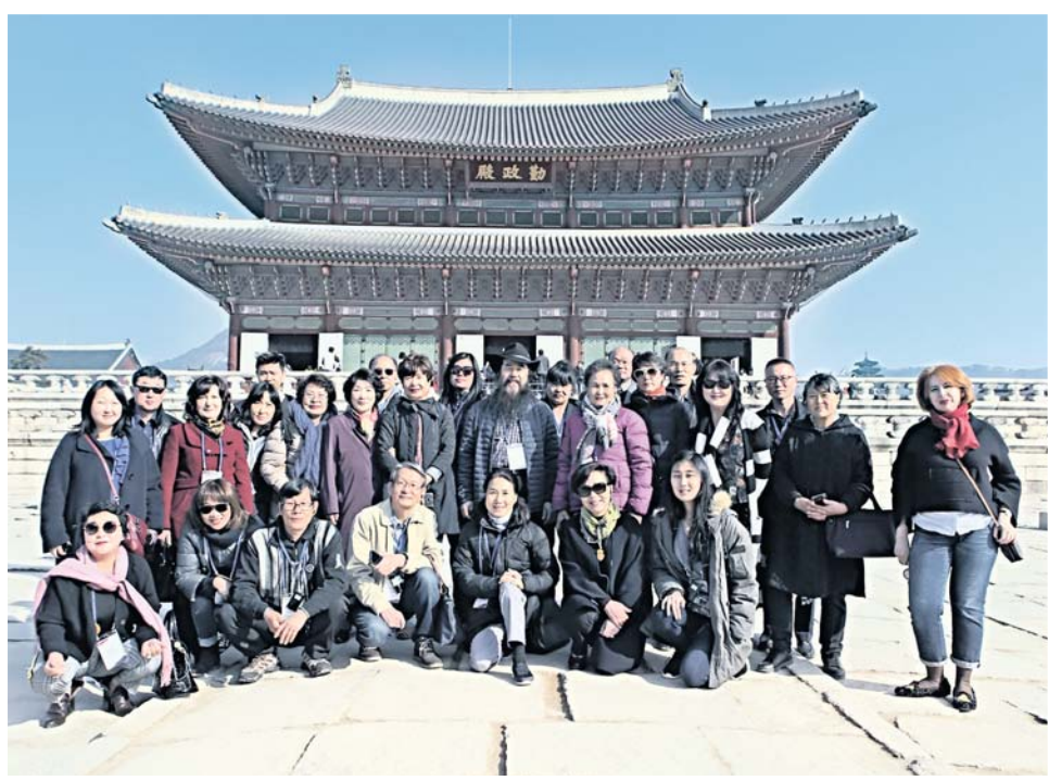
Первая группа потомков борцов за независимость Кореи

После Первомартовского движения за независимость Кореи в 1919 году жесткий полицейский режим со стороны японских колонизаторов вынудил корейских борцов и патриотов покинуть пределы родины. Основная масса мигрировала на советский Дальний Восток.