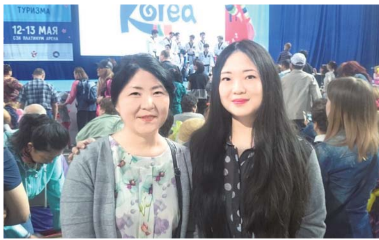
Внучка и правнучка Тен Хон Соба

В один из дней 1937 года дедушка пришел домой и сказал: «Я арестован». При обыске у него отобрали