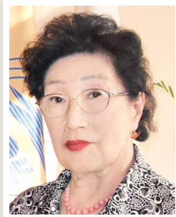
Российской медицинской академии последипломного непрерывного профессионального образования.

Российский специалист в области торакальной лёгочной хирургии, кандидат медицинских наук, доцент. После окончания Самаркандского медицинского института и ординатуры 1-го Московского гос. медицинского института на протяжении свыше 40 лет была соратником выдающегося советского ученого, основателя известной в стране и за ее пределами школы легочной хирургии лауреата Ленинской и Государственной премий СССР академика Льва Константиновича Богуша. Является практическим хирургом, терапевтом, преподавателем