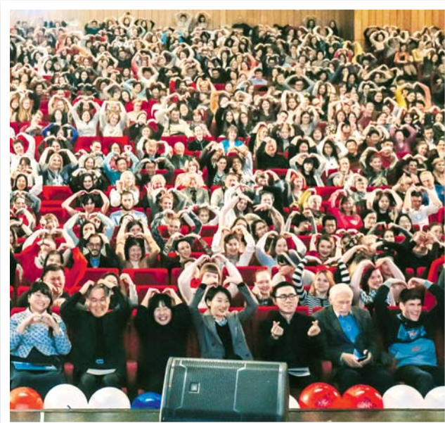
Всех гостей попросили сделать корейское сердечко

фильм, поймут ли его? В то же время я с нетерпением ждала встречи с российским зрителем. И была очень рада, когда увидела, что все они не только понимают, но и наслаждаются им. Я очень благодарна за то,