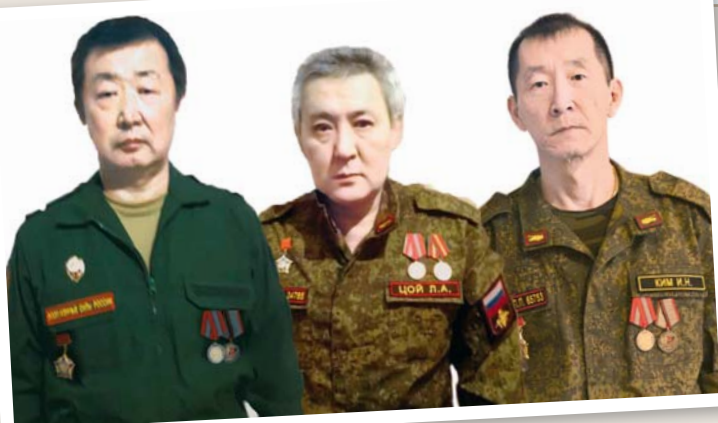
...они же – в 2019 году

За свою трудовую деятельность заработал на две кооперативные квартиры в Ташкенте, был полон сил и оптимизма, всё складывалось отлично, пока существовал СССР. После распада страны нормально жить было невозможно, а дети