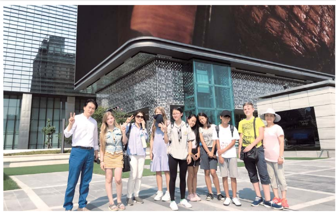
〈한국을 방문한 한울학당 학생들 사진 = 한울학당 제공〉

회에는 모스크바 이외에 예카테린부르크, 볼고그라드 등에 소재한 16개 학교가 등록돼 있다. 모스크바에 소재한 2곳 세종학당과 달리 한울학당은 고려인을 중심으로 이들 자녀들을 위한 맞춤형 교육을 펼치고 있다. 오후 1시, 초등학생 한글 수업이 끝나자 중고생으로 보이는 고려인 청소년이 사무실 밖에서 왈칵 지껄 농담을 나누면서 시종일관 파란대소다. 남녀 학생들의 옛된 얼굴은 한국의 중고등학생들인데 쓰는 언어는 러시아어다. 슬라브계 외모를 가진 학생들도 드문드문 보이지만 한울학당에 다니는 아이와 청소년들은 95%가 고려인 자녀들이다. 수업 참여 학생은 10여 명으로 1명을 제외하고는 모두 고려인 자녀였다. 앞 수업과는 다르게 비교적 진지하다. 정확한 발음으로 문장을 읽고 이를 번역하는 방식이다. 초반에 잡아주지 않으면 발음 교정이 어렵기 때문에 천 교장은 초급반에서 특히 발음에 주의를 기울인다. ‘한글과 한국 문화의 보급과 전파’라는 여타 재외한글교육기관과 달리 한울학당은 한민족의 얼과 정체성 고양이 목표다. 그 때문에 고려인 자녀들이 중심이 되지만 그렇다고 한글을 배우겠다고 찾아오는 슬라브계 아이들을 막을 수는 없는 노릇이다. 금발에 푸른 눈을 가진 아이들이 자리에 앉아있는 이유다. “한울 학당은 여타 세종학당과 다르게 우리의 한민족인 고려인 동포를 대상으로 운영하고 있어요. 고려인 자녀에 민족적 자존감과 정체성을 심어줘야겠다고 마음먹은 것이 한국어 교사가 된 계기가 됐지요. 고려인 아이들이 한민족으로서 유구한 역사를 가지고 있는 민족이라는 자긍심을 가지고 살아갈 수 있도록 ‘민족의 얼’을 심어주고 싶었어요. 그러한 학당 특수성 때문에 학당 운