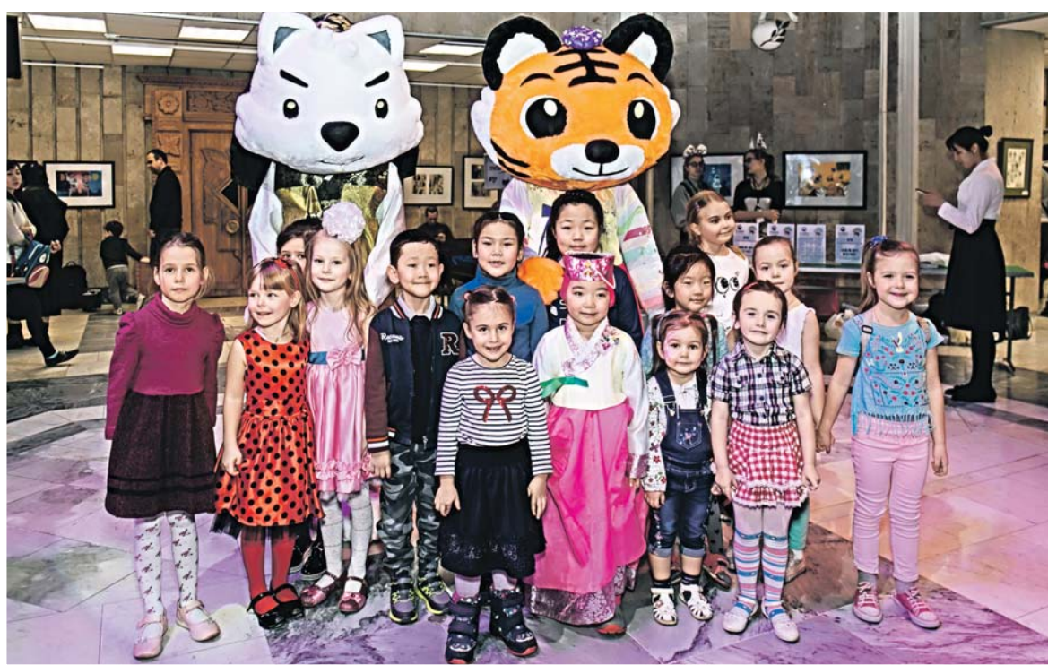
Гости праздника с официальными символами тхэквондо Чин-Чинном и Тэраном

традиционных играх, примерить корейский традиционный костюм ханбок и сфотографироваться в нем.