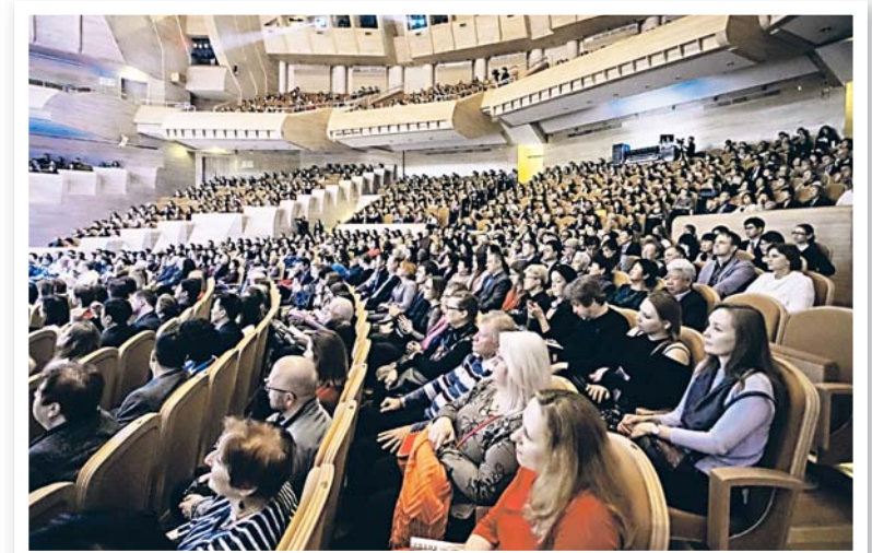
Зрительный зал Дома музыки

концерт «Голос Кореи: Чан Са Ик «Чиллэ Кот», организатором которого выступил Культурный центр Посольства Республики Корея в Москве.