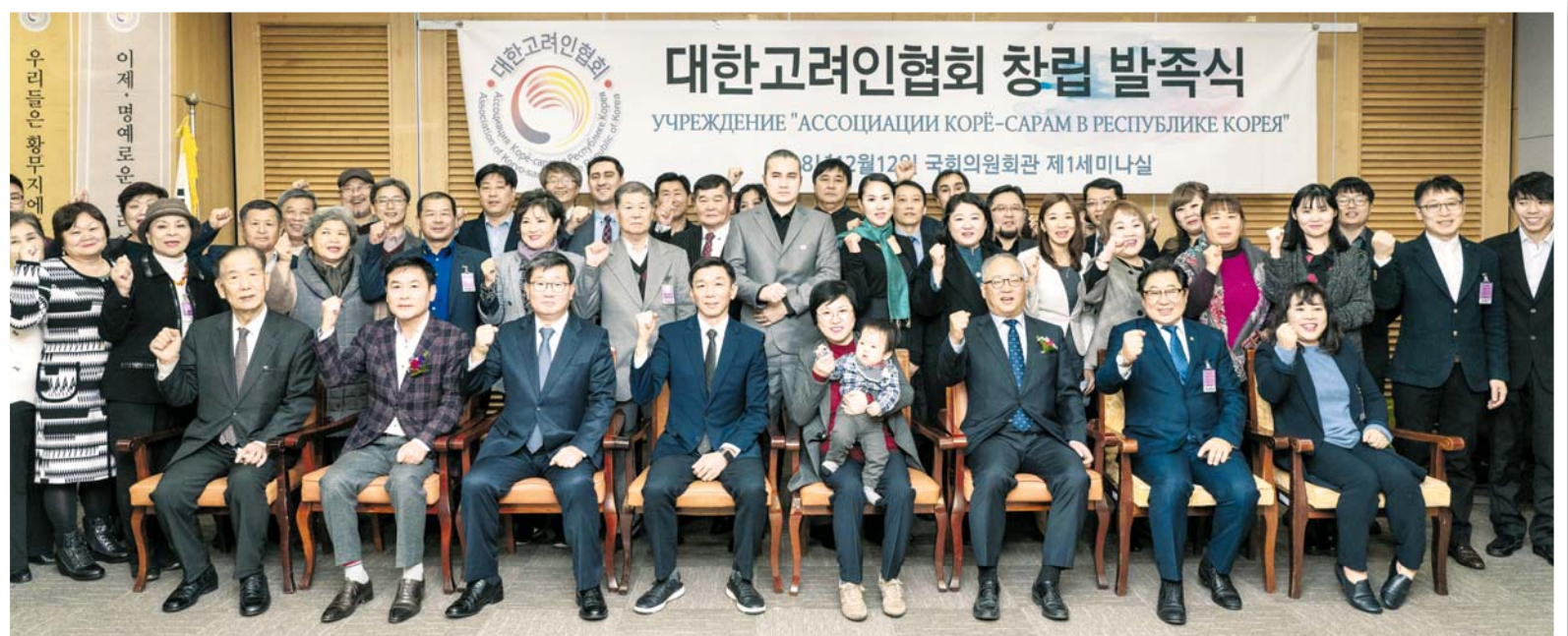
Это поколение корейцев выбрало для жизни историческую Родину

Во-вторых, прежде в Южной Корее действовали два законодательных акта, регулирующие отношения с диаспорой: «Закон об иммиграционном контроле» (1963) и «Закон о зарубежных соотечественниках» (1988). В соответствии с ними этническим корейцам из западных стран предоставили возможность получать специальные визы, приобретать недвижимость и проводить финансовые сделки.