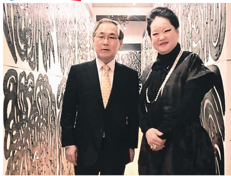
С послом Республики Корея в РФ У Юн Гыном