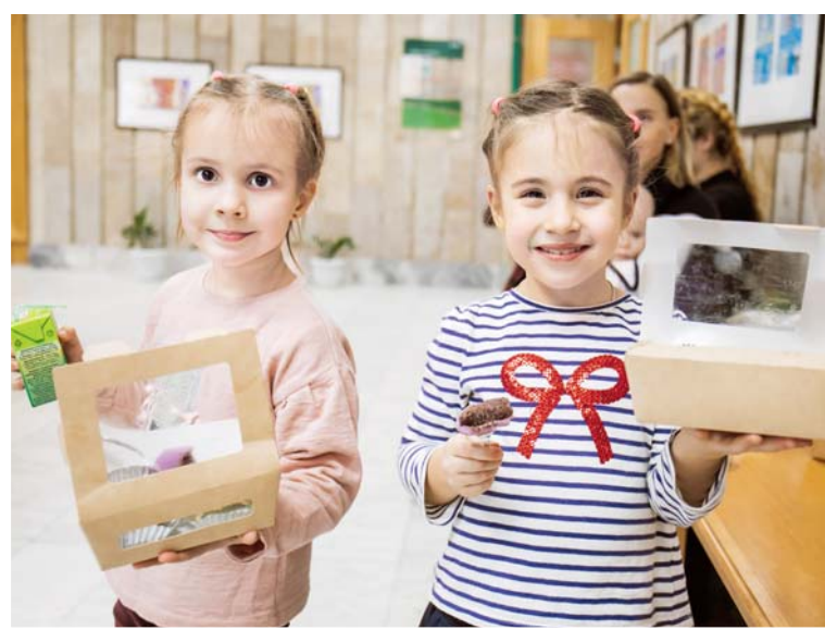
На празднике можно было попробовать традиционную корейскую еду

Празднование продолжилось концертной программой. Дети могли узнать, что такое лунный календарь и почему он отличается от солнечного, а также сами попробовать сделать новогодний приветственный поклон.