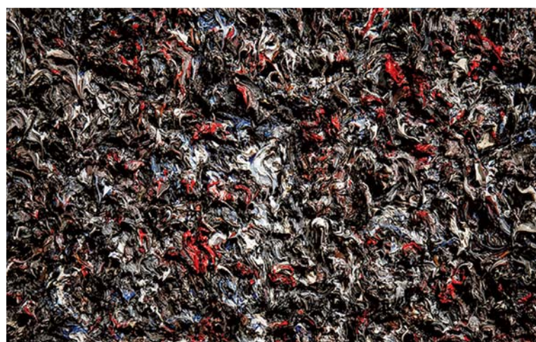
Фрагмент картины художницы