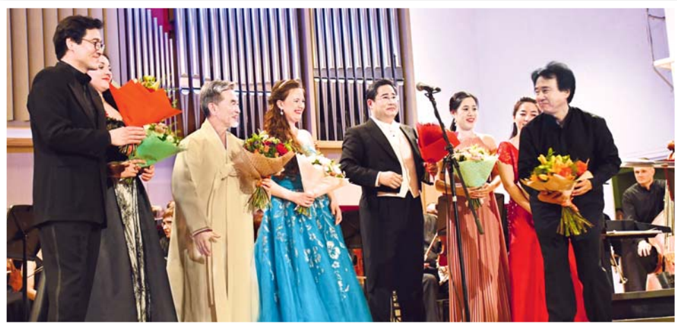
6 июля в Большом зале Свердловской филармонии прошёл вечер симфонической музыки

С 7 по 12 июля в МВЦ «Екатеринбург-ЭКСПО» состоялась международная промышленная выставка «ИННОПРОМ-2018», на которой Культурный центр Посольства Республики Корея вместе с Национальной организацией туризма Республики Корея познакомили гостей с корейской культурой.