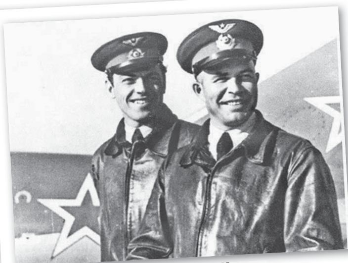
НЕИЗВЕСТНАЯ ВОЙНА В ФОТОГРАФИЯХ ..... стр. 2