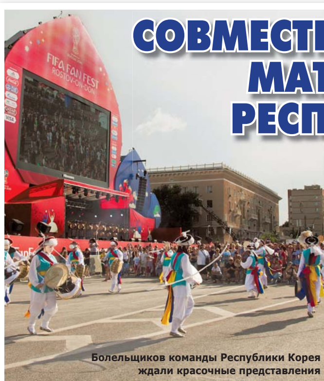
Болельщиков команды Республики Корея ждали красочные представления

шоу Тхэквондо (традиционное боевое искусство корейской нации) и многое другое! Колоритная программа показала зрителям уникальность и многогранность корейской культуры, а также объединила болельщиков со всего мира.