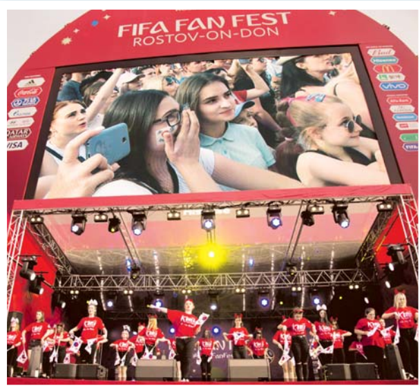
Праздник корейской культуры прошёл 23 июня в Ростове-на-Дону

Яркий праздник корейской культуры состоялся 23 июня в самом сердце Ростова-на-Дону в фанзоне на Театральной площади во время Кубка Мира по футболу в России.