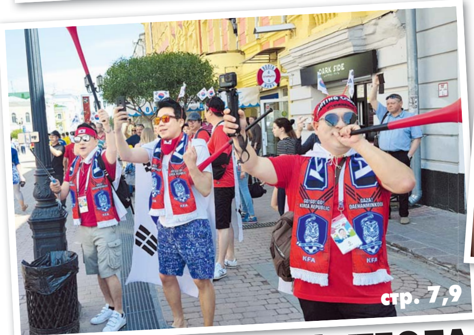
ЭХО БОЛЬШОГО ФУТБОЛА стр. 7,9