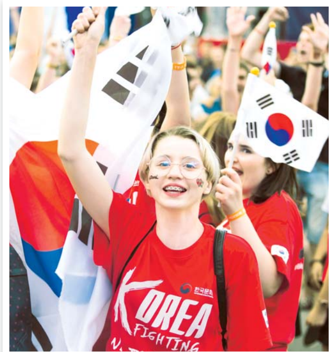
Фестиваль объединил болельщиков со всего мира

Культурный центр Посольства Республики Корея совместно с Отделом по международным связям Союза кинематографистов России провёл Фестиваль корейского футбольного кино в двух городах, где прошли отборочные матчи национальной сборной: в Нижнем Новгороде и Ростове-на-Дону.