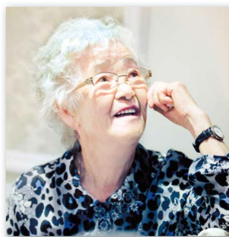
БЕРЕГИТЕ ВАШИХ МАТЕРЕЙ! ..... стр. 7