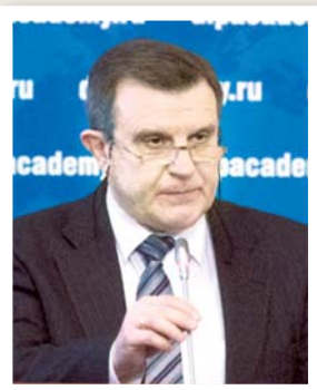
департамента Азии МИД России.