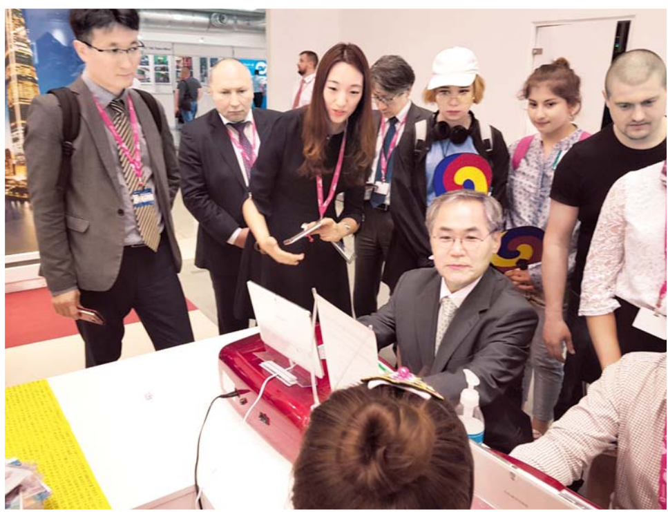
Стенд культуры и туризма Кореи посетил Чрезвычайный и Полномочный Посол Республики Корея в РФ господин У Юн Гын

7 июля в Большом зале екатеринбургского Дома кино прошли бесплатные кинопоказы в рамках проведения «Года корейского кино 2018: Перезагрузка» в преддверии главной международной промышленной выставки «ИННОПРОМ-2018», страной-партнёром которой была выбрана Республика Корея. На большом экране были показаны фильмы «Кай: Легенда зеркального озера» (2016, режиссер Ли Сон Ган) и «Мисс жена» (2015, режиссер Кан Хё Джин). Также в рамках мероприятия были подготовлены танцевальное выступление в стиле k-поп, фотозона и викторина по фильмам с интересными призами. Кинопоказ посетили более 500 зрителей.