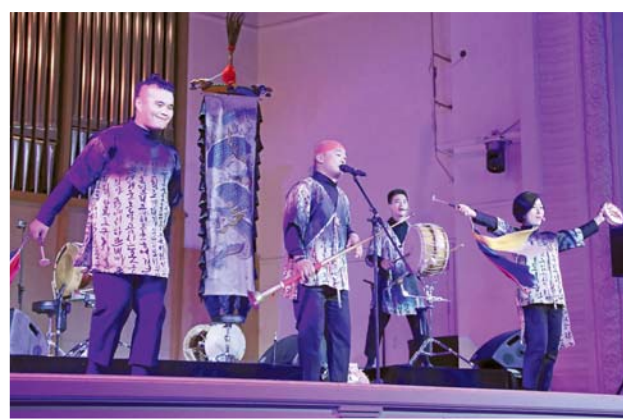
Зал наполнила энергия группы «Норым мачи»