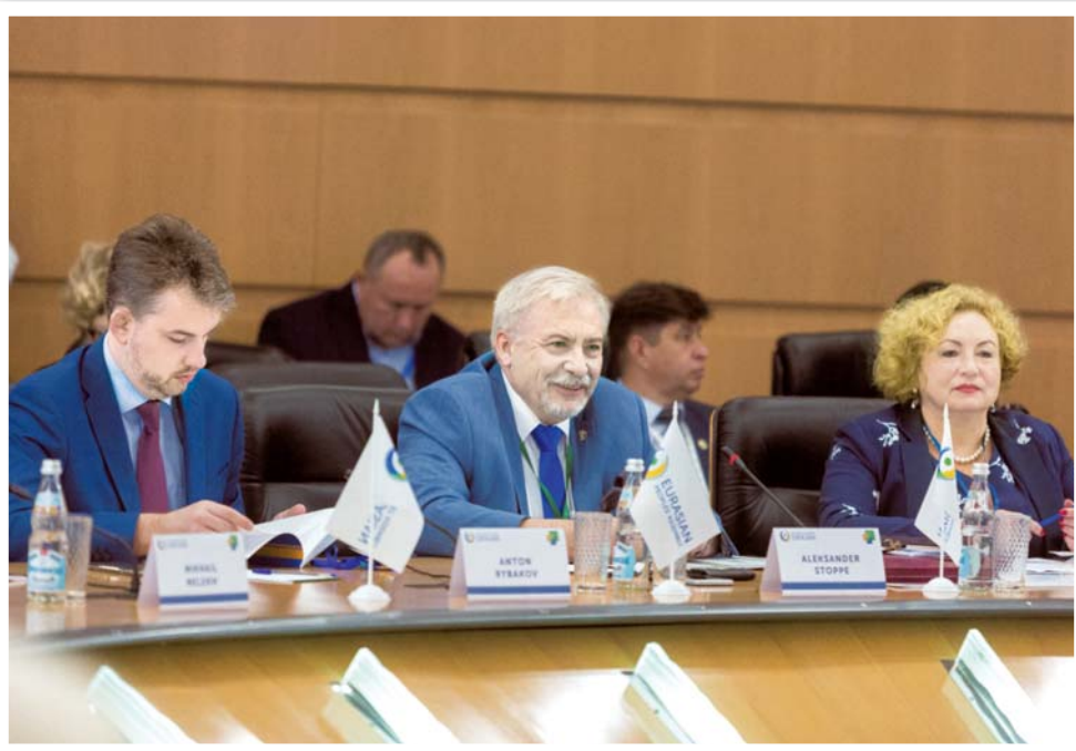
ЕВРОПА И АЗИЯ – ТЕРРИТОРИЯ МИРА ..... стр.4