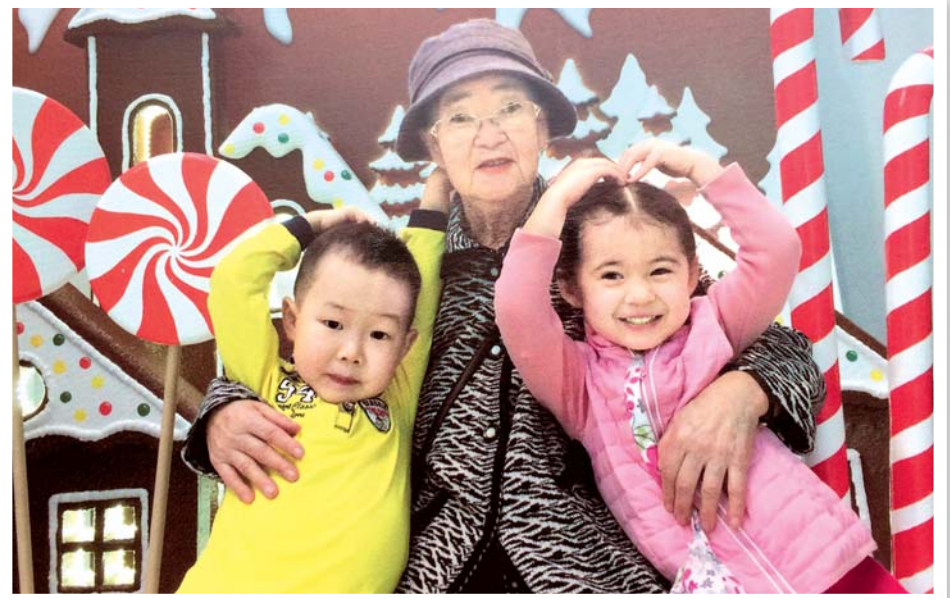
Мама с внуками

Два года Ростов-на-Дону жил в ожидании Чемпионата мира по футболу ЧМ-2018!