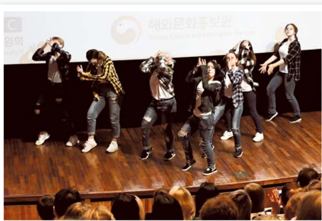
Кинопоказы были организованы в преддверии выставки «ИННОПРОМ-2018»

За время выставки более 50 000 гостей выставки посетили стенд Республики Корея и ощутили на себе обаяние корейской культуры.