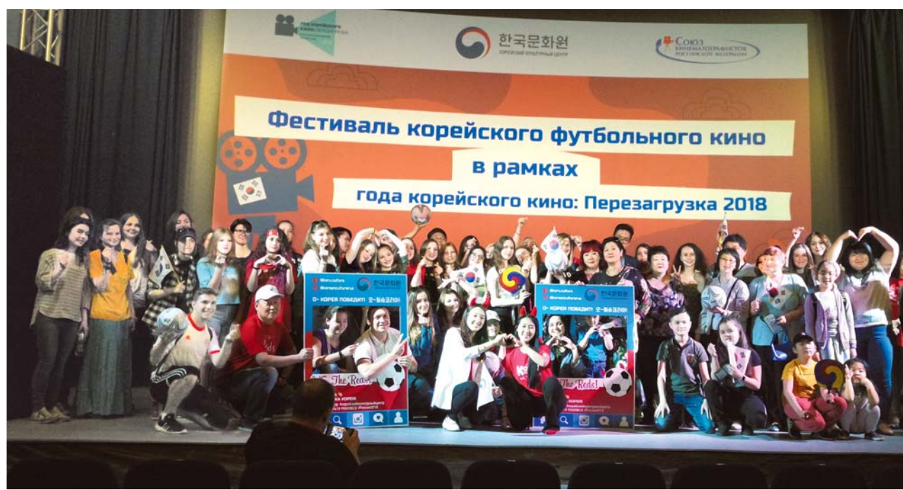
В двух городах прошёл Фестиваль корейского футбольного кино