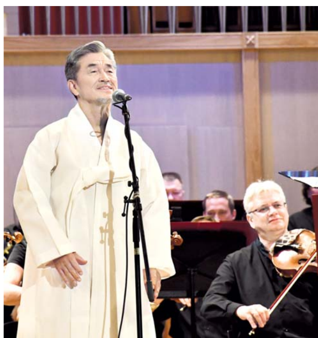
Своим сильнейшим вокалом поражал зрителей Чан Саик