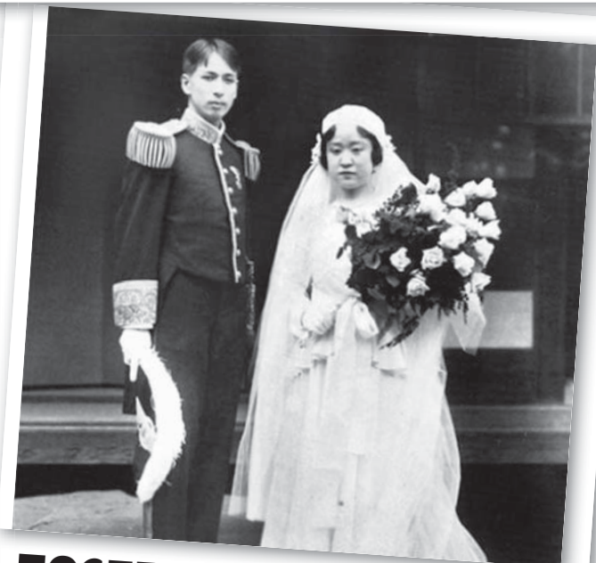
ПОСЛЕДНЯЯ КОРЕЙСКАЯ ПРИЦЕССА ..... стр. 10