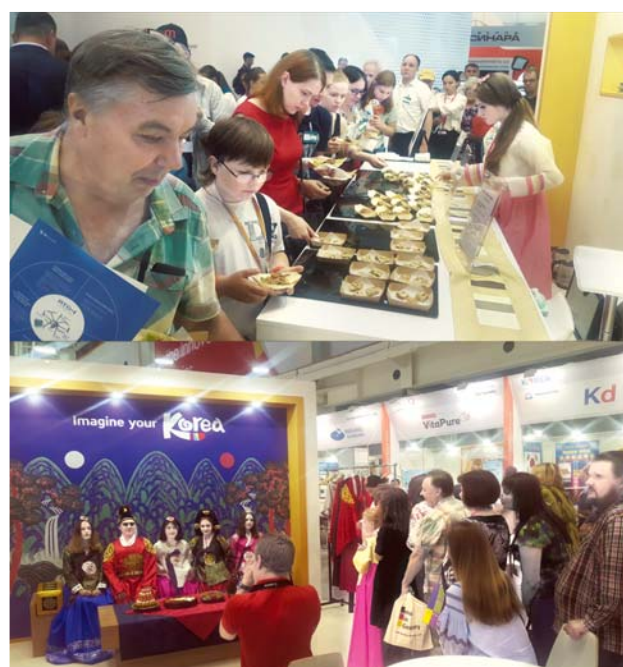
Гости стенда смогли попробовать корейскую кухню, а также сфотографироваться с королём и королевой