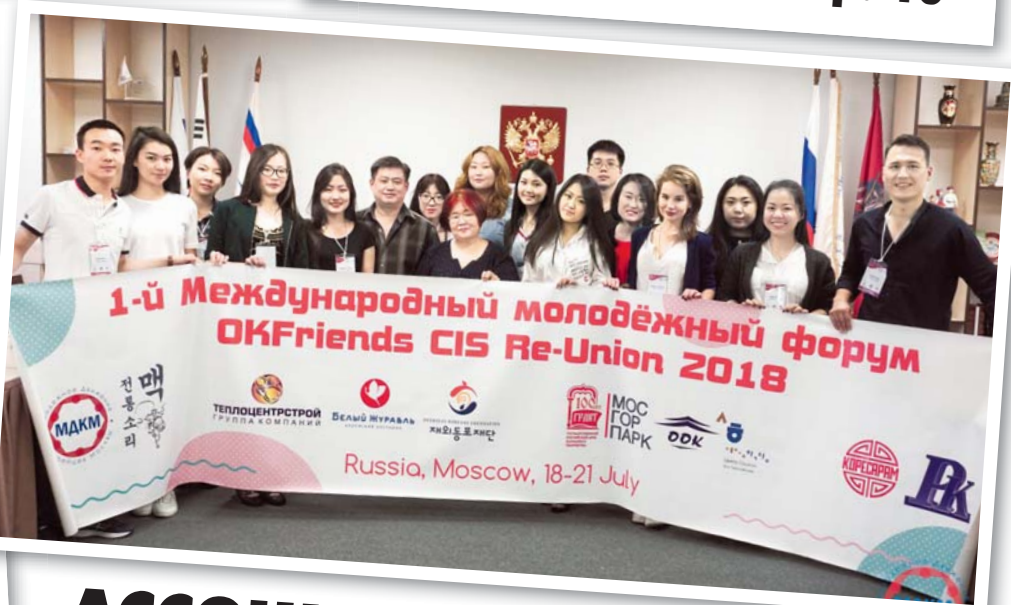
АССОЦИАЦИИ КОРЕЙСКОЙ МОЛОДЕЖИ РОССИИ БЫТЬ! стр. 5