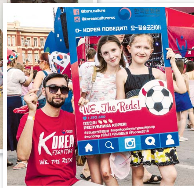
Поддержать «Красных дьяволов» пришли и самые маленькие

гримом на лице и сделать фото на память со специальными рамками. Также среди зрителей была проведена лотерея, в ходе которой можно было выиграть фирменную футболку корейского футбольного болельщика и другие призы.