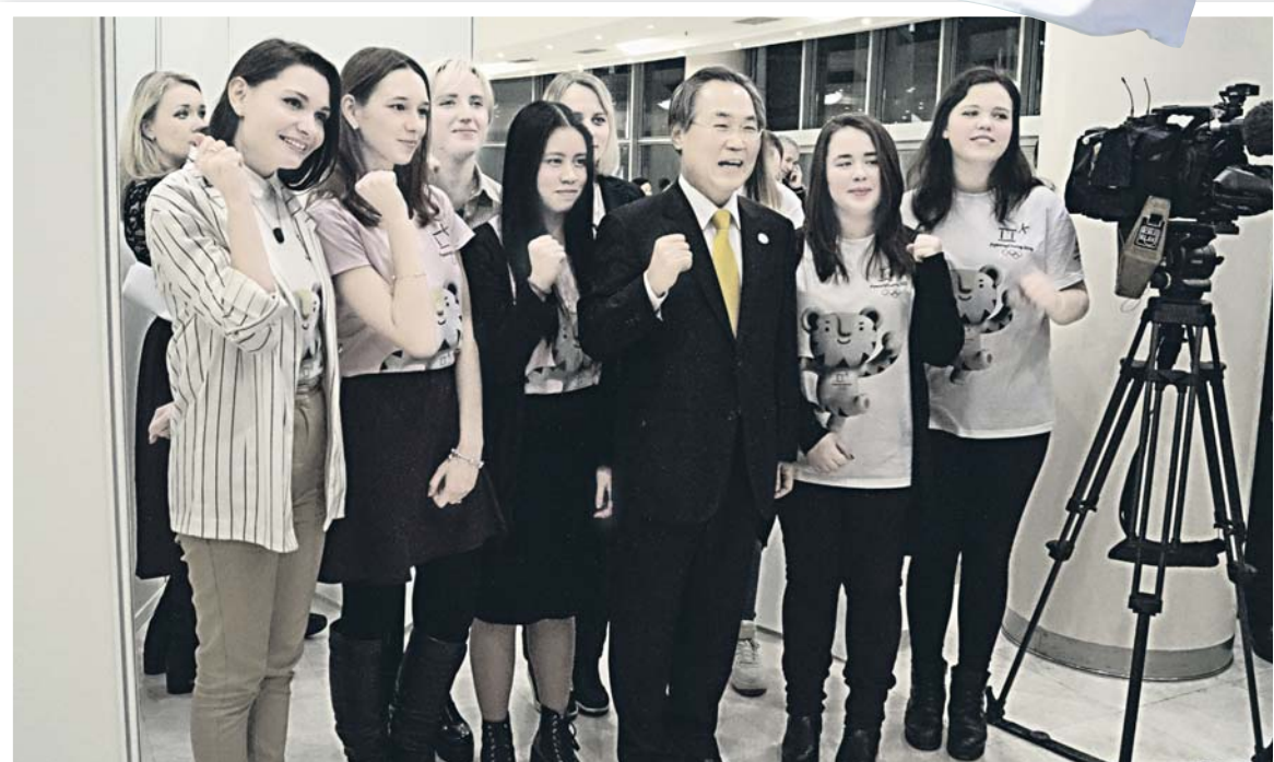
Посол Республики Корея с членами российской группы по поддержке Олимпийских зимних игр в Пхёнчхане 2018 и Олимпийской команды России