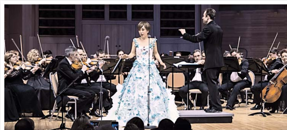
Поет Чо Суми