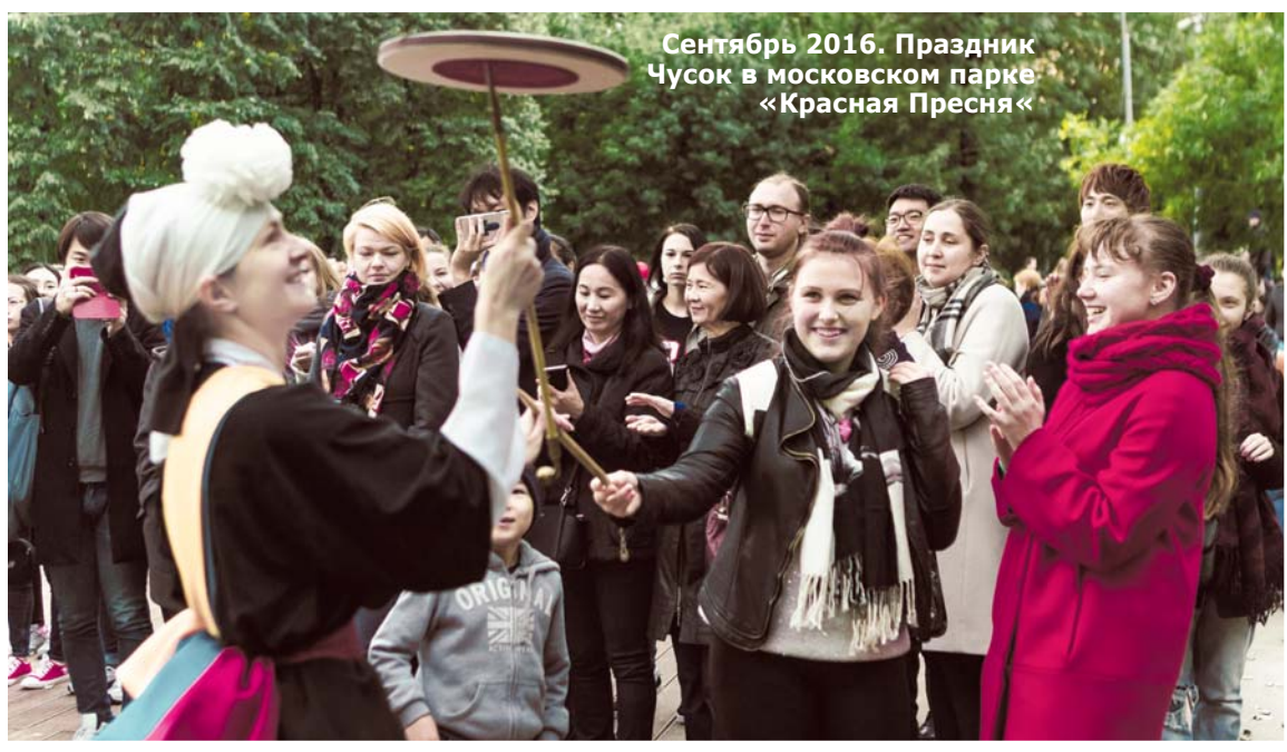
Сентябрь 2016. Праздник Чусок в московском парке «Красная Пресня»