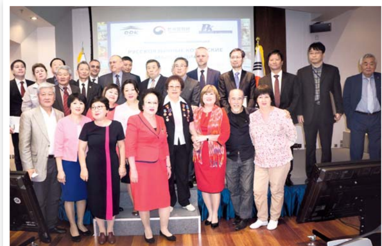
Май 2017. Корейские журналисты России, Узбекистана и Казахстана на 20-летию газеты «Российские корейцы»

из Алматы и «Сэ Корё синмун» из Южно-Сахалинска и представитель интернет-изданий сайт «Корё сарам». 1 июня в конференц-зале ООК состоялся круглый стол по вопросам 80-летия депортации корейцев из Дальнего Востока в Среднюю Азию и Казахстан. В нём приняли участие многие иногородние и зарубежные учёные, специалисты-корееведы и общественные деятели, прибывшие на 20-летний юбилей газеты «Российские корейцы».