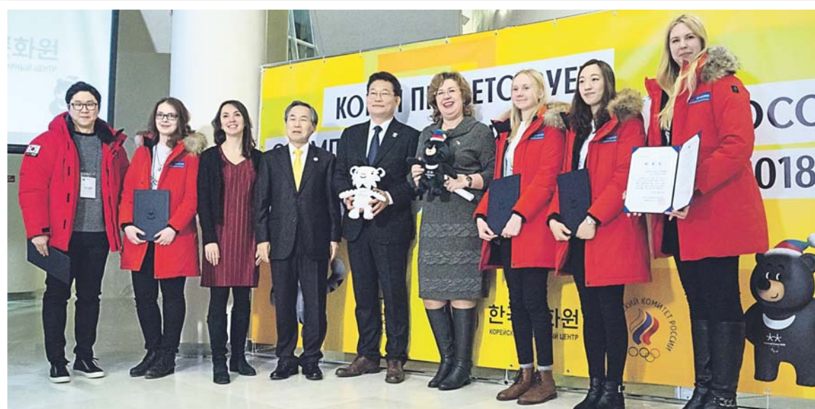
Памятная фотография на приёме, посвящённом мероприятиям в поддержку российских спортсменов на Олимпийских зимних играх в Пхёнчхане