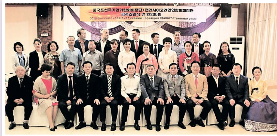
Июнь 2017 г. Первый в истории визит делегации ООК в Яньбяньскую корейскую автономию в Китае

Вся деятельность ООК осуществляется в соответствии с Уставом ООК, решениями общего собрания, а в перерывах между ними – президиума Совета.