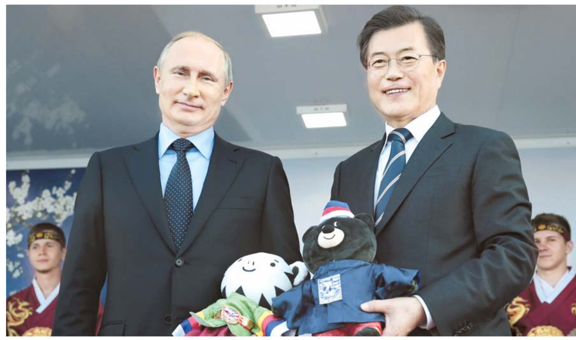
Владимир Путин и Мун Чжэ Ин. Корейская тема всегда была актуальной для российской власти

Как Родина (Россия) относится к этому? Вопрос, скорее, риторический. Никто никому ничего не запрещает.