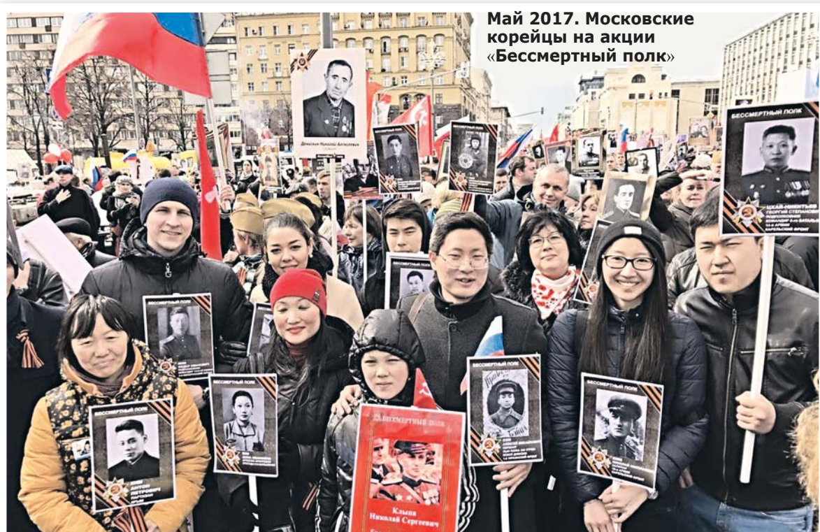
Май 2017. Московские корейцы на акции «Бессмертный полк»

года в Москве. 4-5 октября 2014 года в Москве прошли заключительные юбилейные мероприятия празднования 150-летия добровольного переселения корейцев в Россию.