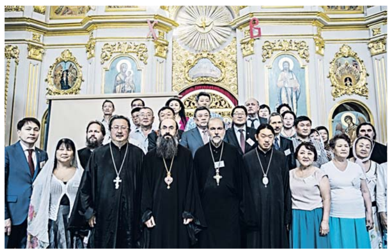
Май 2014. Конференция «Корейцы и православие» Заиконоспасском мужском монастыре

В Москве, в честь 20-летия газеты «Российские корейцы» 31 мая состоялась международная конференция: «Русскоязычные корейские медиа: прошлое, настоящее, будущее», в которой приняли участие все русскоязычные корейские газеты – «Корё синмун» (Ташкент), «Корё синмун» (Уссурийск), «Корё сарам» на Дону и две старейшие двуязычные газеты «Корё ильбо»