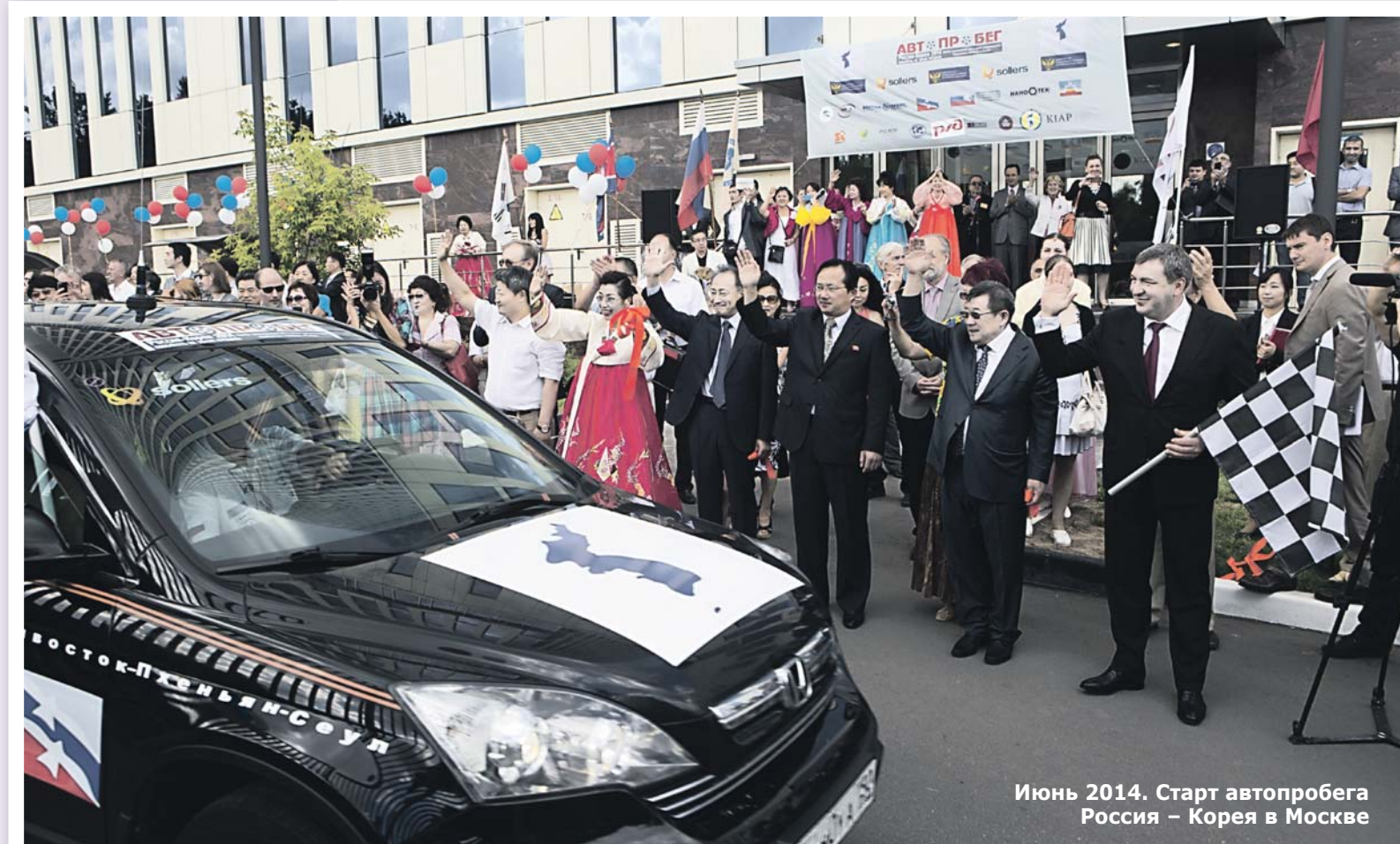
Июнь 2014. Старт автопробега Россия – Корея в Москве

Для достижения поставленных целей ООК осуществляет всю свою деятельность только в рамках установленных и не запрещенных в Российской Федерации