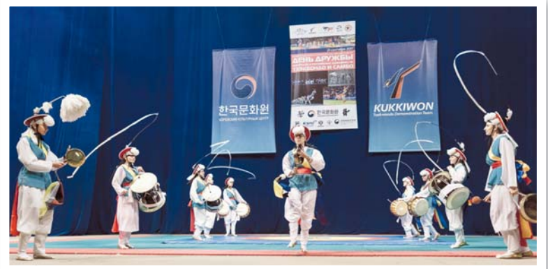
Гостей встречали ритмы корейских барабанов самульнори, исполненные группой «МЭК»

Надеемся, что вы продолжите активно посещать мероприятия Корейского культурного центра. Мы всегда рады видеть вас!