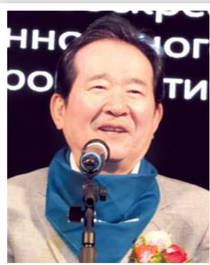
Спикер парламента Республики Корея Джонг Се Гюн

Трудное положение мигрантов усугубляется проблемами с социальной поддержкой, бытовыми трудностями,