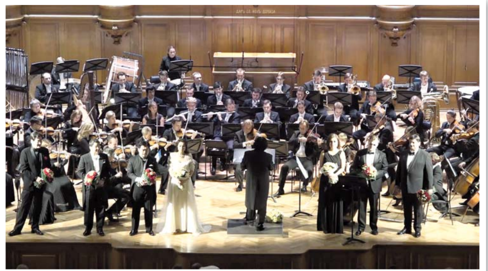
Фестиваль продолжился в Большом зале Консерватории имени П.И. Чайковского, где состоялся концерт «Шедевры мировой оперной классики»