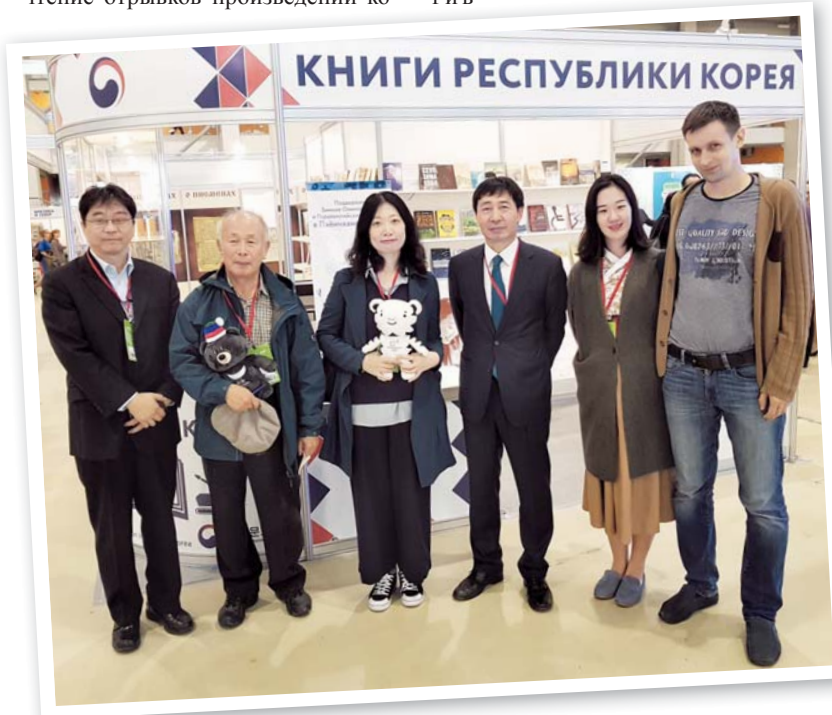
Корейская литература была представлена на Московской международной книжной выставке-ярмарке

Затем соревнования проходили в Новосибирске, Казани, Барнауле, Елабуге и Набережных Челнах. И вот Липецк принимал лучших бойцов тхэквондо. На открытии соревнований присутствовали Чрезвычайный и Полномочный Посол Республики Корея в Рос-