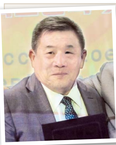
Уважаемые организаторы и участники форума!

Прежде всего позвольте поблагодарить организаторов за приглашение. Сегодня заканчивается работа форума и мне хотелось бы высказать мнение о взаимоотношениях российских корейцев и стран СНГ с Фондом зарубежных корейцев и ассоциация-