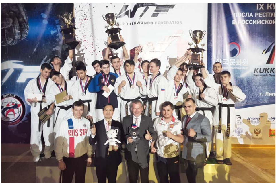
IX Всероссийский турнир по тхэквондо «Кубок Посла Республики Корея в Российской Федерации»

Vkontakte: vk.com/korean_cultural_center Facebook: www.facebook.com/koru.culture Instagram: www.instagram.com/koreanculturerus Youtube: www.youtube.com/c/КорейскийКультурныйЦентрМосква Сайт КЦ: info-korea.ru