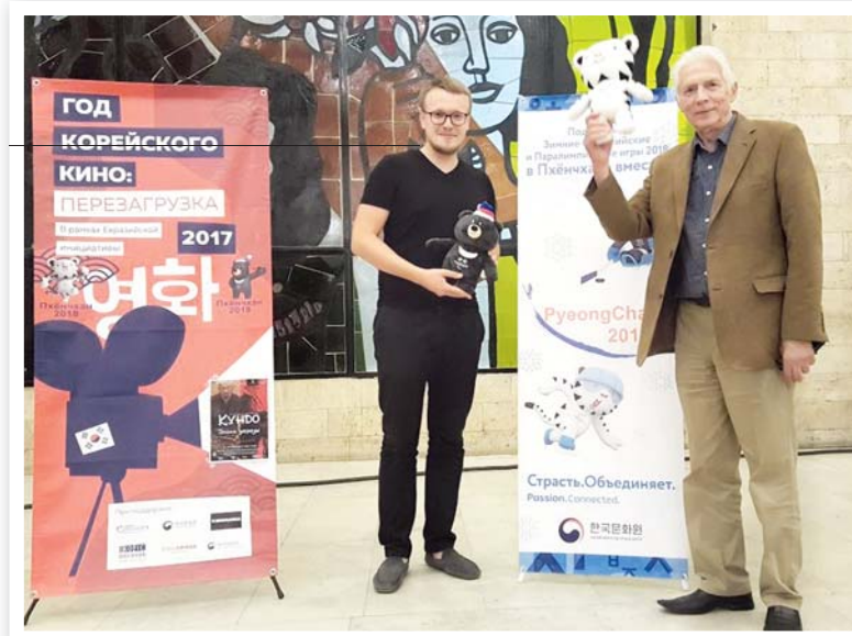
В рамках фестиваля была показана корейская историческая драма «Кундо: эпоха угрозы»

но развиваться. Сначала оно было, в основном, посвящено освобождению, потом стало показывать жизнь народа, а в последние годы особенно интересно то, что оно очень отличается от российского кинематографа. Кинематограф Республики Корея отражает жизнь людей,