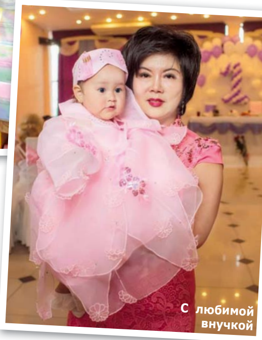
С любимой внучкой

Несколько слов о самом мероприятии. Важное место в нем организаторы уделили обряду поминовения