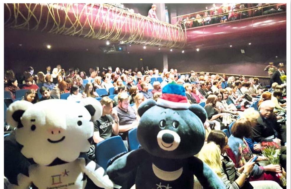
Талисманы Зимних Олимпийских игр 2018 года в Пхёнчхане Сухоран и Пандаби активно посещали мероприятия фестиваля культуры