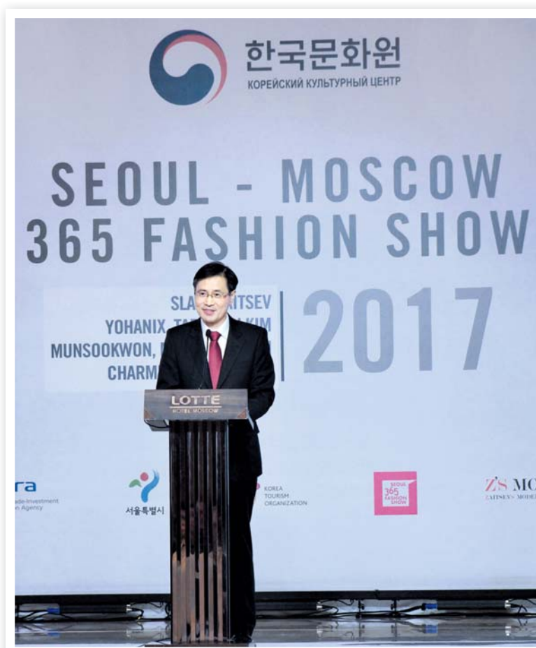
Три бренда корейской и один бренд российской одежды были представлены на «Seoul-Moscow 365 Fashion Show 2017»

Выважкой книг Республики Корея на Московской международной книжной ярмарке открылся Осенний фестиваль корейской культуры в России 2017, проводимый Корейским культурным центром при поддержке Министерства культуры Российской Федерации. Этот фестиваль корейской культуры проходил уже во второй раз после весеннего фестиваля, Меморандум о проведении которого был подписан Посольством Республики Корея и Министерством культуры Российской Федерации 31 мая 2017 года. В программу осеннего фестиваля вошли концерты, выставки, показы кино, мюзиклы, фэшн-шоу и выступления по тхэквондо.