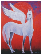
Подготовка Мария Ким

Во многих провинциальных музеях также проводят выставки, посвященные новому году. Посетить их считает своим долгом большинство населения Республики Корея.