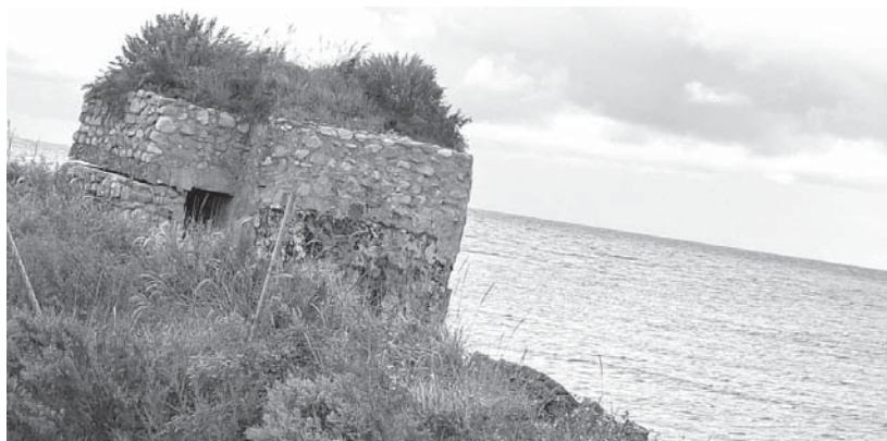
Бутокаменный ДОТ, прикрывавший позиции батареи № 252 на мысе Гаккеля.