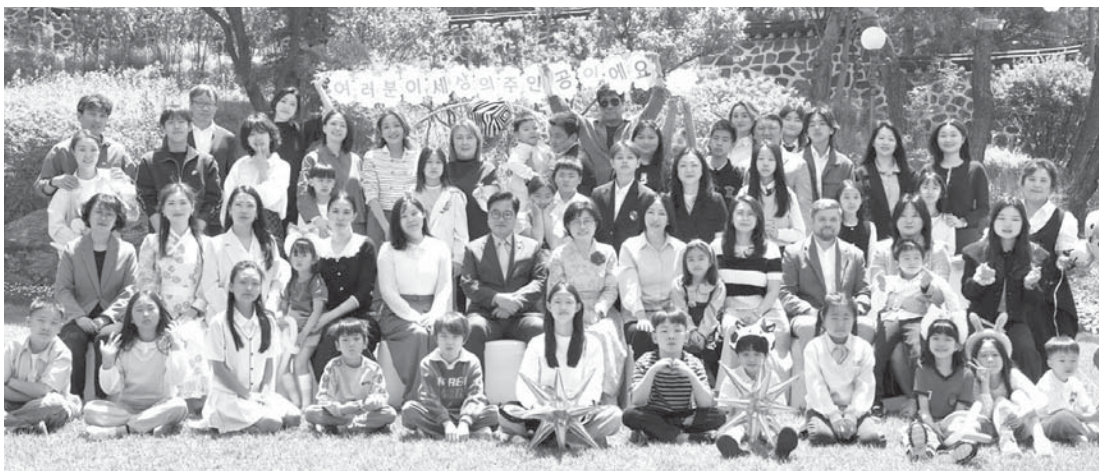
Дети приготовили к встрече рисунки и письма.

Очень быстро стало понятно, что главными героями этого дня будут именно дети. Они познакомились, играли, отвечали на вопро-