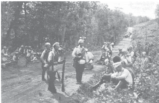
Дорога на Барабаш из Славянки. Журнал «Разведчик» (12*) от 11 февраля 1897 г.