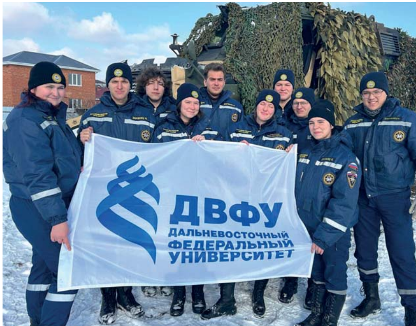
Волонтеры ДВФУ на фоне трофейной техники.