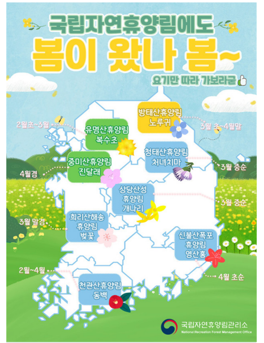
국립자연휴양림 봄꽃 지도

한편, 이 무렵에는 전국적으로 봄꽃 축제가 열리는 곳도 많아 국립자연휴양림에서 숙박이나 야영을 하며 인근 지역의 축제를 함께 즐겨도 좋다. 전국 45개 국립자연휴양림의 객실이나 야영데크를 이용하고자 할 때는 전국 자연휴양림 통합예약시스템인 '숲나들이'를 통해 예약하면 된다.