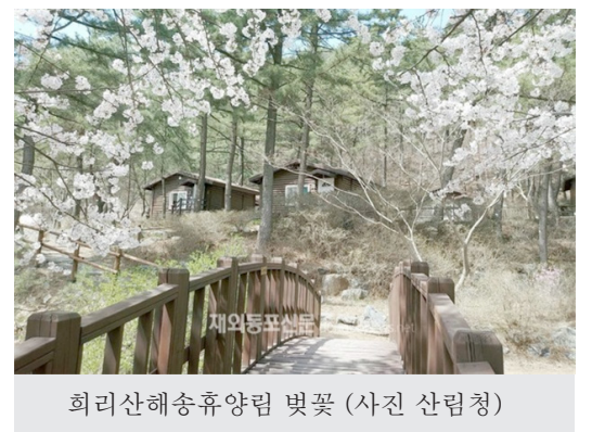
희리산해송휴양림 벚꽃