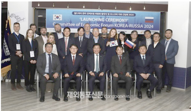
월드옥타는 2월 28일 러시아 모스크바 중소벤처기업진흥공단 GBC에서 '한·러경제포럼위원회' 발대식을 개최했다.