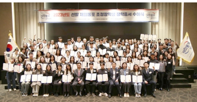
재외동포협력센터는 29일 서울 서초구 양재동 엘타워에서 23개국에서 온 100명의 재외동포 차세대에게 모국 장학증서를 수여했다.

(서울 = 연합뉴스) 강성철 기자 = 재외동포청 산하 공공기관인 재외동포협력센터(센터장 김영근)는 서울 서초구 양재동 소재 엘타워에서 '2023년도 재외동포 초청장학생 장학증서 수여식'을 개최했다고 2월 29일 밝혔다.